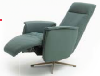
Relaxsessel BACCARA in Leder W2 opal