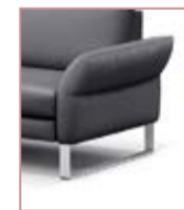
Armlehne B klappbar