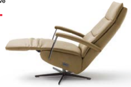
Relaxsessel BEPPO in Leder; inkl. elektrische Relaxfunktion; Fuß- und Armlehnstrebe in Metall schwarz;