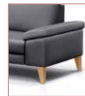
Armlehne A klappbar